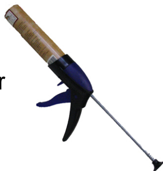
Pistolet pour cartouches ALGI