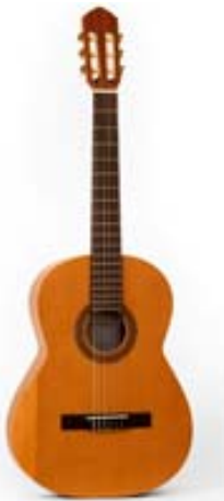
Guitare Ricardo Montes CC20